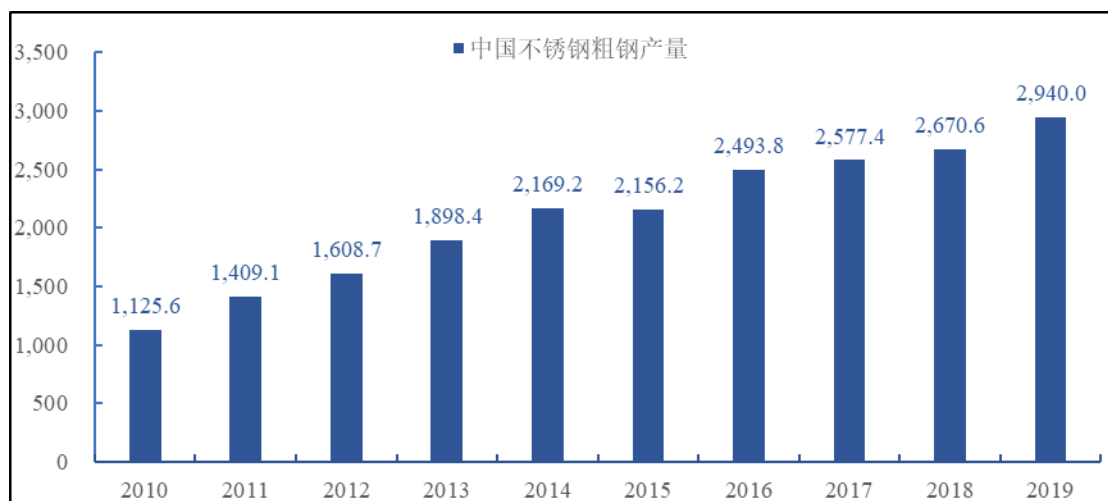
2010~2019年中国不锈钢粗钢产量（单位：万吨）